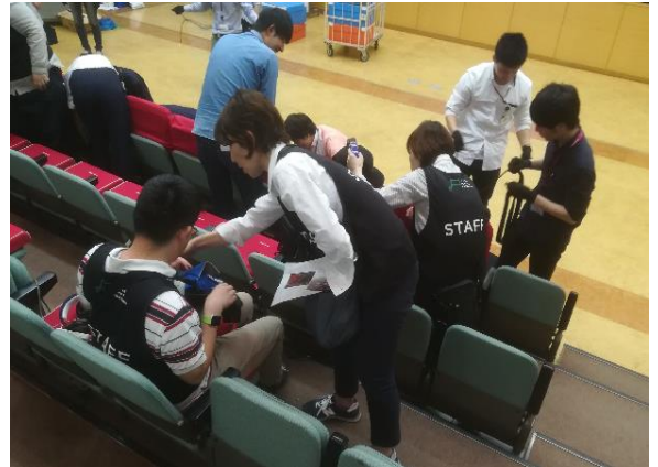
身体で聴こう音楽会