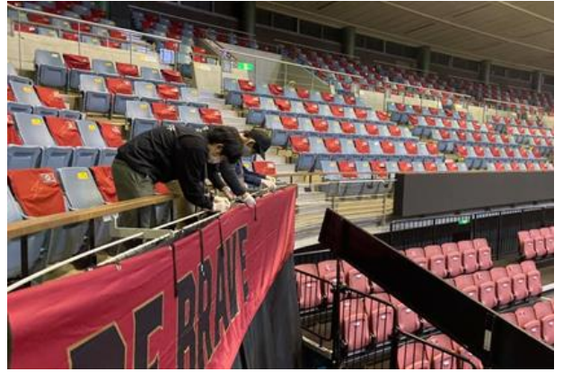
川崎ブレイブサンダース