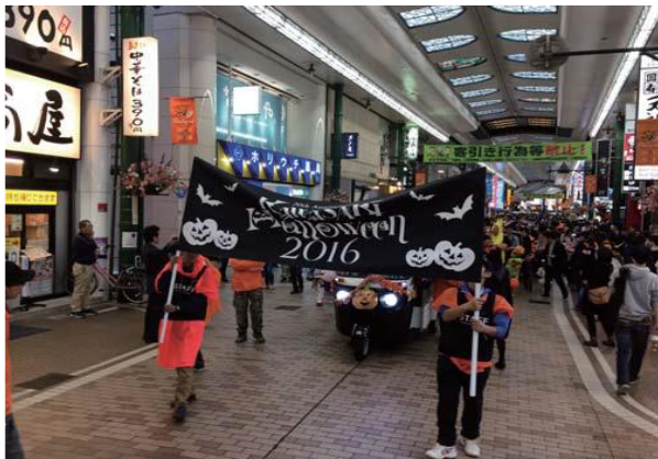
かわさきハロウィン