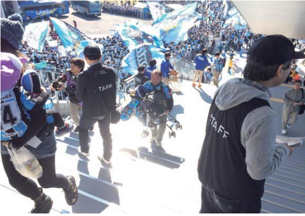
川崎フロンターレ